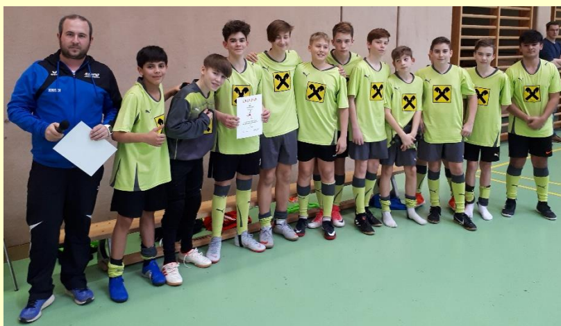
U15-Fußball-Team der Sport- & Kreativmittelschule Korneuburg

Das polysportive Angebot soll den jungen Sportlerinnen und Sportlern eine vielseitige und fundierte Grundausbildung ermöglichen sowie auf ein freudvolles Bewegen ein Leben lang vorbereiten.